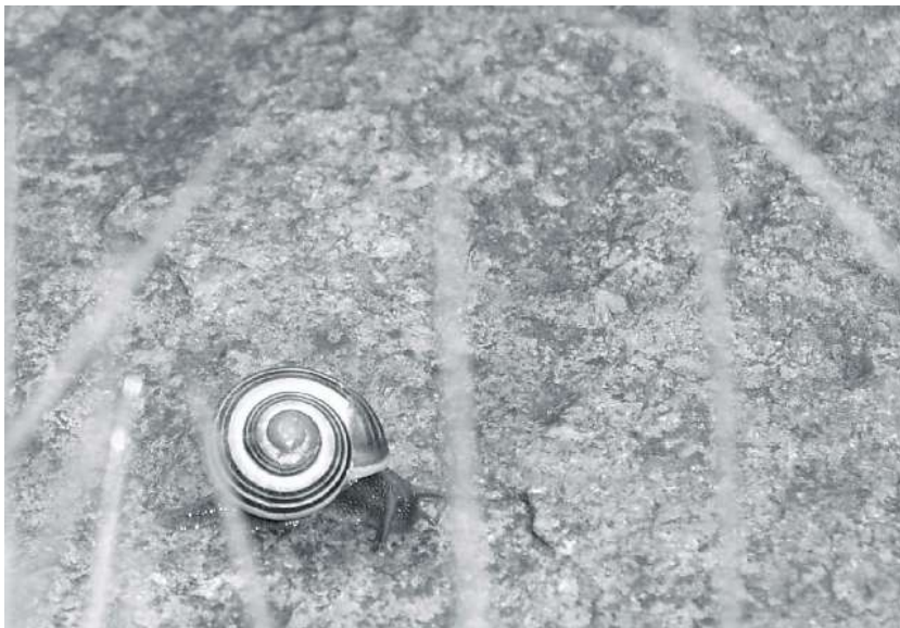
Auf dem Weg zur Mitte ...