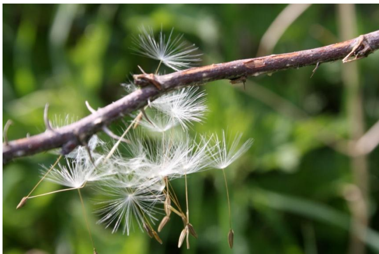
Die Samen sind unterwegs.