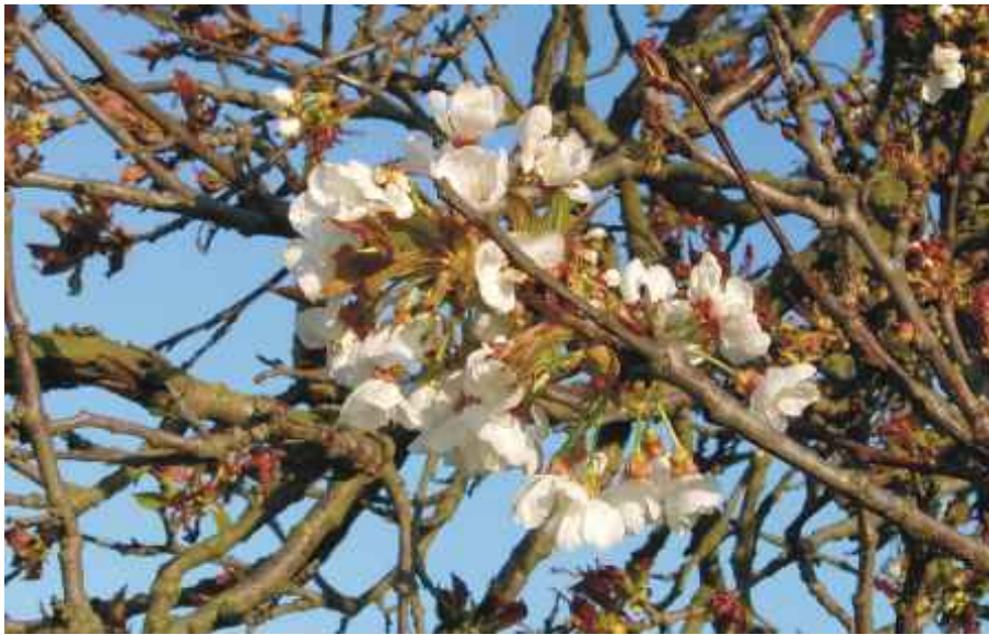
Die Kirschblüten in der Kirschallee sind eine Augenweide. Wir freuen uns schon auf die roten Früchte.