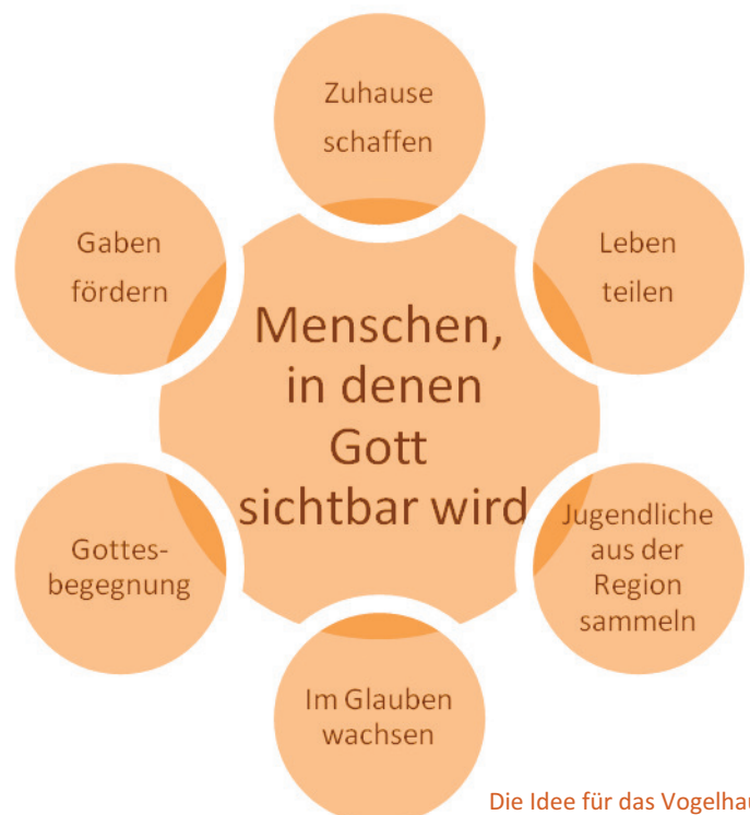
Die Idee für das Vogelhaus