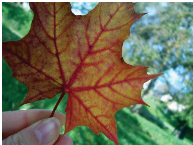
Herbstbäume - Vorbilder im Loslassen